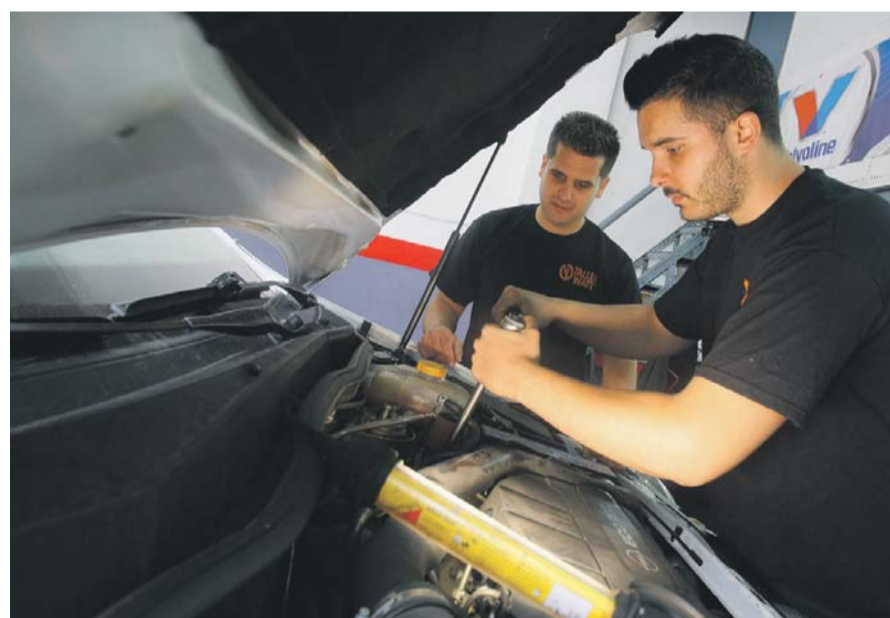
El tallers agremiats disposen d'una àmplia oferta de serveis.