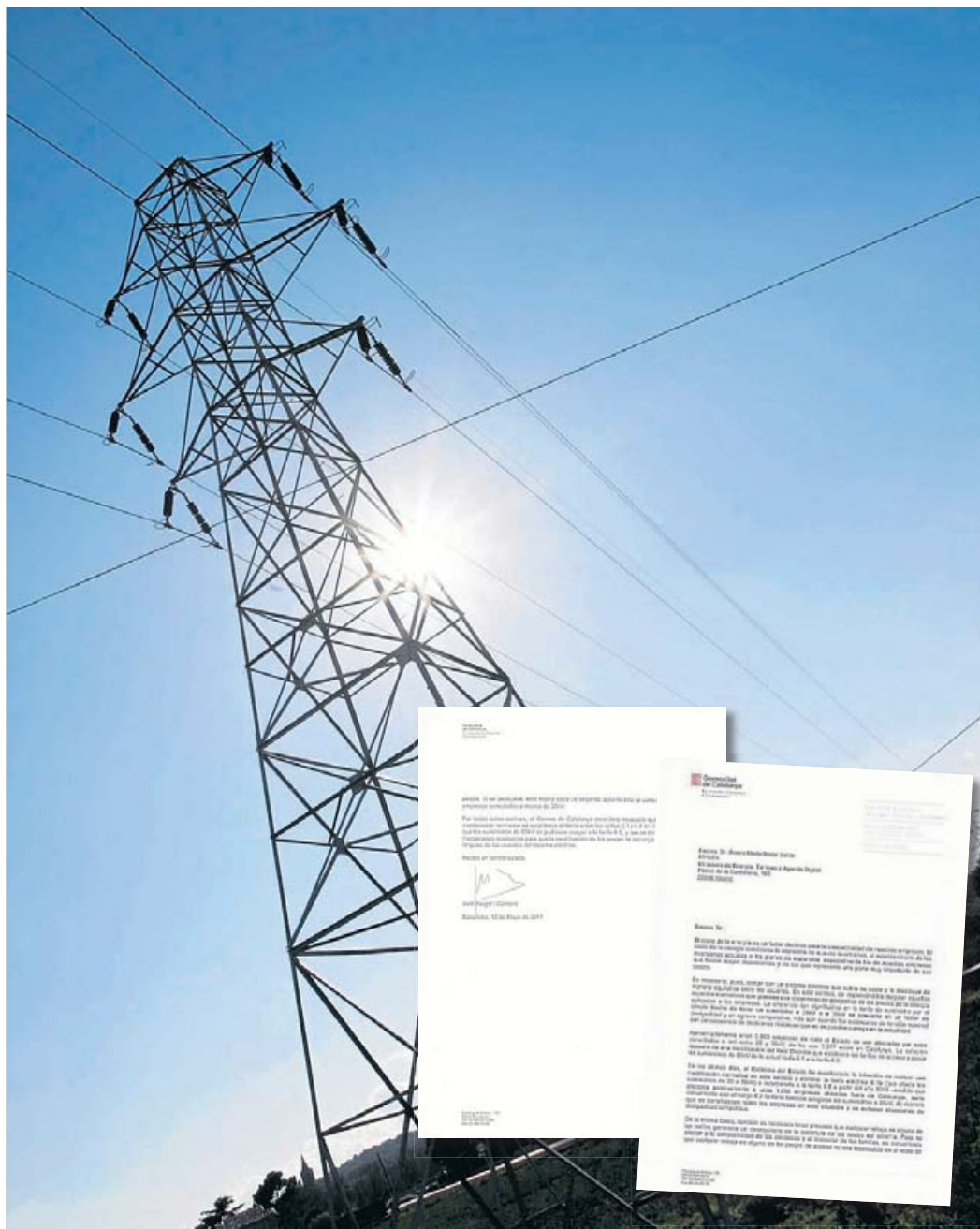
La diferència de les xarxes elèctriques fa que les indústries catalanes no puguin gaudir dels canvis de tarifa, cosa que és un greuge, segons diu el conseller en la carta al ministre. CÈLIA ATSET

Fins ara hi ha tres tarifes industrials: la 6.1A, d'1 quilovolt (kV) a 30 kV; la tarifa 6.1B, de 30 kV a 36 kV, i la tarifa 6.2, de 36 kV a 72,5 kV. L'acord preveu suprimir la tarifa 6.1B, de manera que els clients quedarien en la 6.2. Però aquestes tarifes tenen preus molt diferents. Així, el 2016, el preu mitjà de la tarifa 6.1A ha sigut de 32,30 euros el megawatt hora (MWh), la 6.1B de 26,42 euros el MWh i la 6.2 de 14,97 euros el MWh. Per tant, els clients de la tarifa 6.1B, que ara pagaven 26,42 euros el MWh, amb preus del 2016 passarien a pagar 14,97 euros. I amb les previsions de tarifes per a l'any