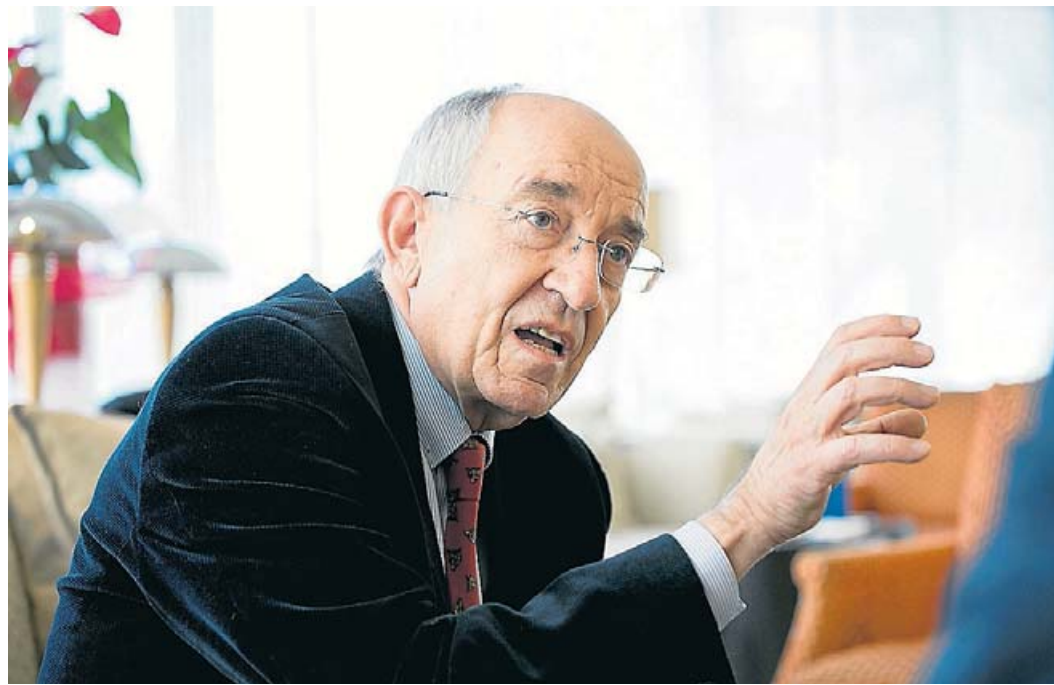
Miguel Ángel Fernández Ordóñez era el governador del Banc d'Espanya el 2011. F. MELCION

La creació d'aquesta tarifa és la que va portar la primera gran rebaixa elèctrica per a les empreses basques, la majoria connectades a 35 kV. Suposava una baixada aproximada del 5% dels peatges, i d'un 15% en el rebut de la llum.