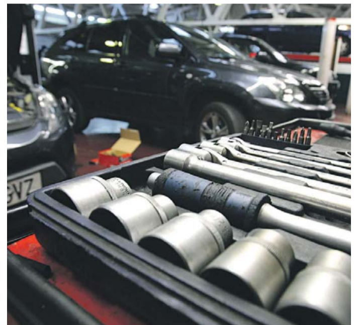
Per un manteniment preventiu del cotxe és fonamental.

Tampoc no ens hem d'oblidar dels carregadors de mòbils i bateries externes, si en tenim. Un mòbil amb la bateria ben carre-