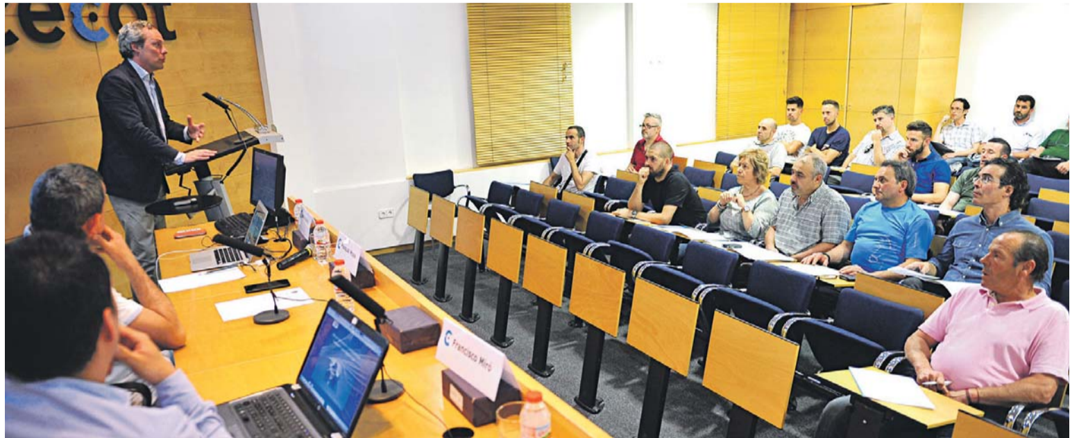
Aquest dimarts, la Cecot va acollir una sessió del gremi per parlar de les relacions dels tallers amb les asseguradores. ALBERTO TALLÓN

Una pràctica que, segons Moya, va en augment. Algunes companyies "pressionen" els seus clients per tal que portin el cotxe sinistrat a tallers amb els quals mantenen convenis. Si no, afegeix, podran ten-