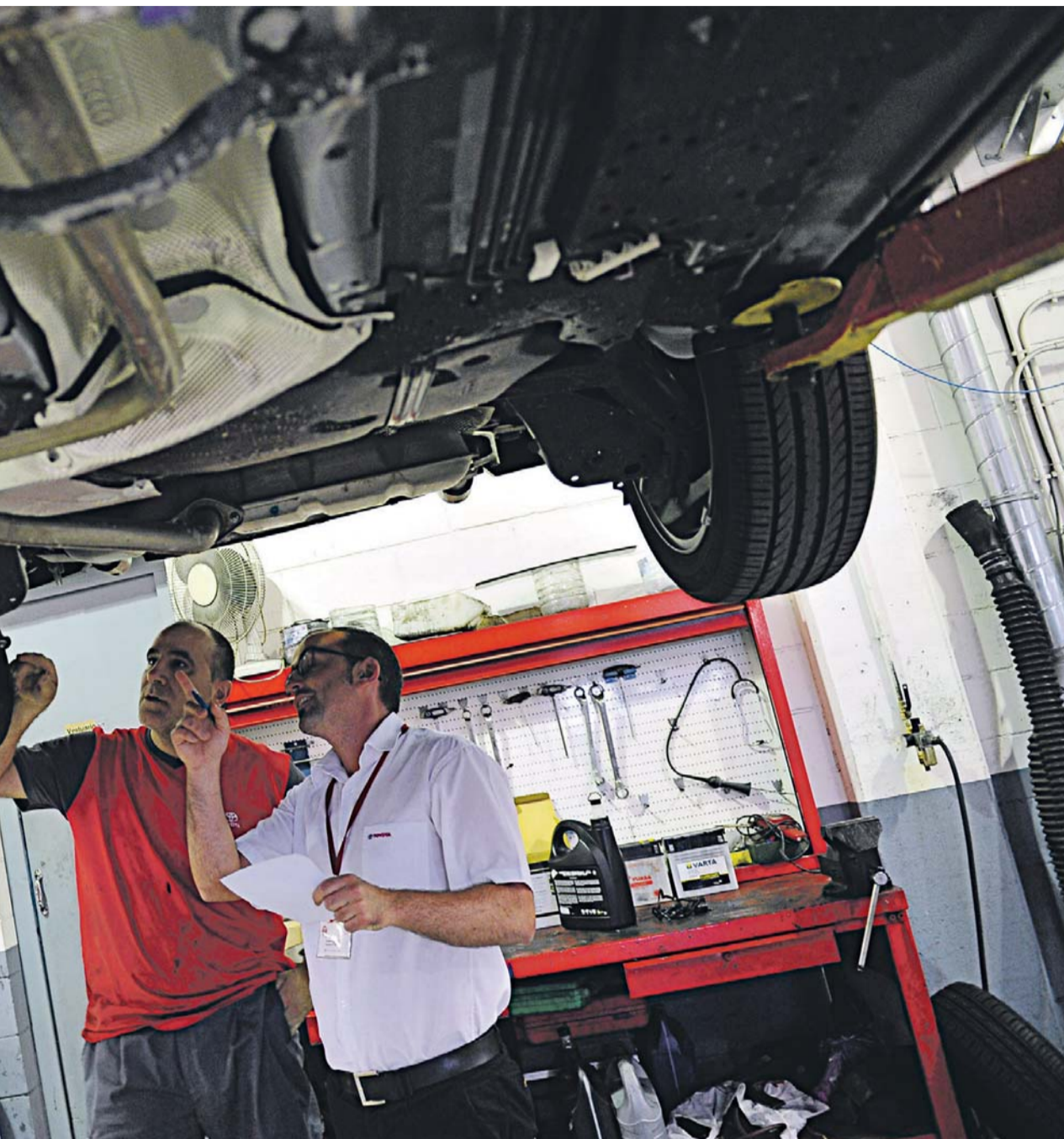
Els tallers mecànics ofereixen un treball de reparació i revisió dels vehicles de total garantia.

cotxe. Respectar els terminis previstos pel fabricant i aquells que siguin propis de cada vehicle permetrà un major rendiment i millorar la seva vida útil. A mesura que es van recorrent quilòmetres, òbviament, les peces del cotxe es van desgastant i alguns fluids experimenten fuites naturals. Així succeeix en l'oli del motor, el líquid refrigerant o el gas que refrigera el circuit de climatit-